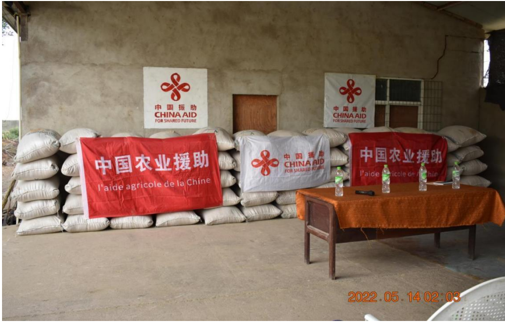
技术组优良水稻种子捐赠现场