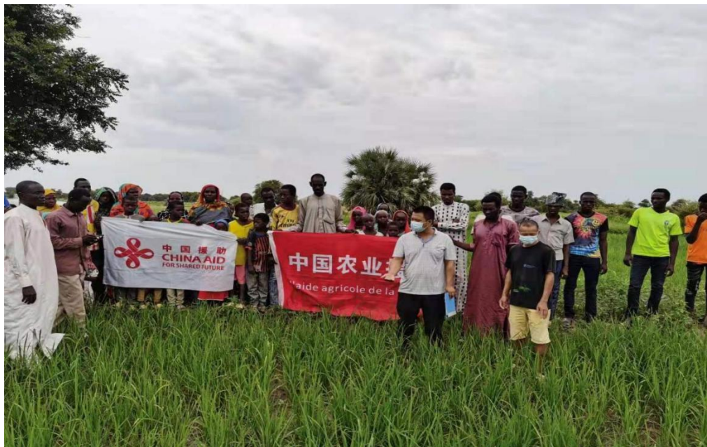
水稻生产技术培训现场