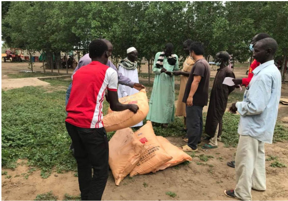
向水稻种植示范户赠送肥料